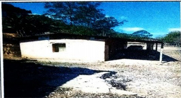
Foto 1: SUSTITUCION DE ENTECHADO, LAMINAS, VENTANAS Y COLOCACION DE BALCONES.