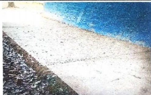
Foto 4: REMODELACIÓN DE PISO TORTA DE CEMENTO A PISO DE GRANITO DEL CORREDOR