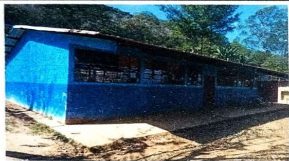
Foto 3: CABIO DE PINTURA INTERNO Y EXTERNO, COLOCACIÓN DE BALCONES, SUSTITUCIÓN DE VIDRIOS, SUSTITUCIÓN DE PISO DE TORTA DE CEMENTO A PISO GRANITO.